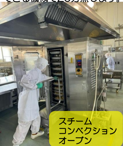
スチーム コンベクション オープン