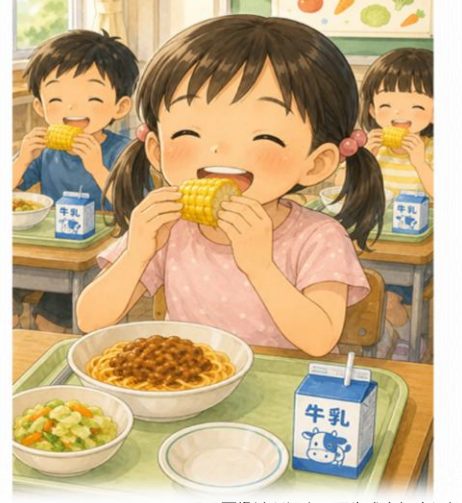
この画像はAIによって生成されました