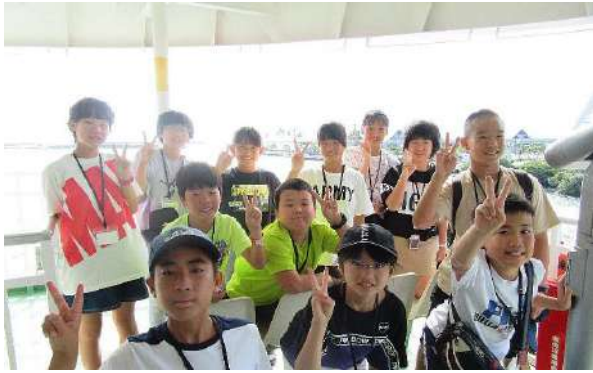
桜島に向かうフェリーにて