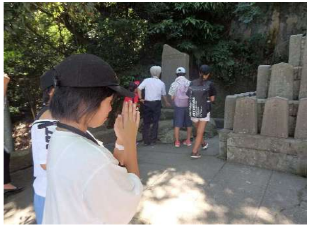
薩摩義士に対して感謝の気持ちを