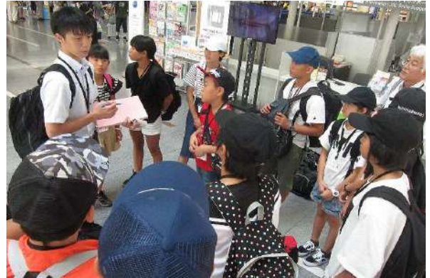
飛行機への搭乗前