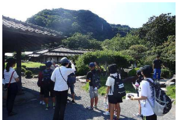
仙巖園・尚古集成館の見学