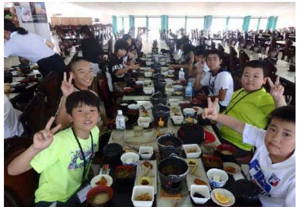
桜島物産館での食事