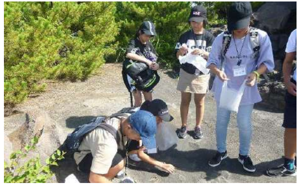
桜島の火山灰を採取