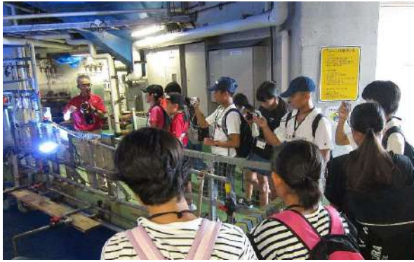
鹿児島水族館 バックヤード見学