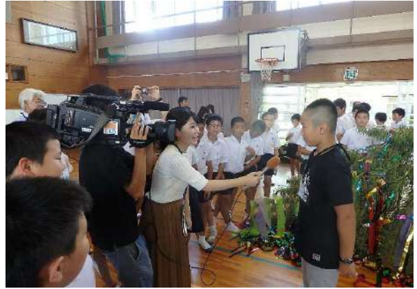
鹿児島テレビ局のインタビュー