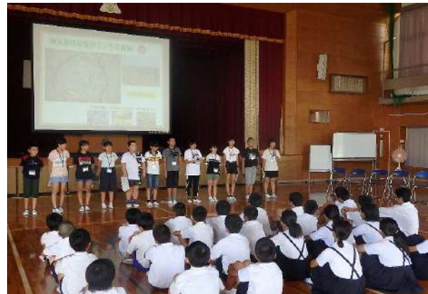
郡山小学校6年生の皆さんに輪之内町を紹介