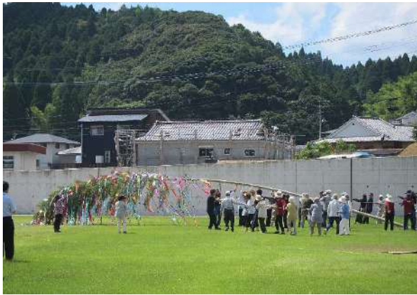
願い事を付けた七夕飾りの完成