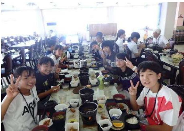
桜島物産館での食事