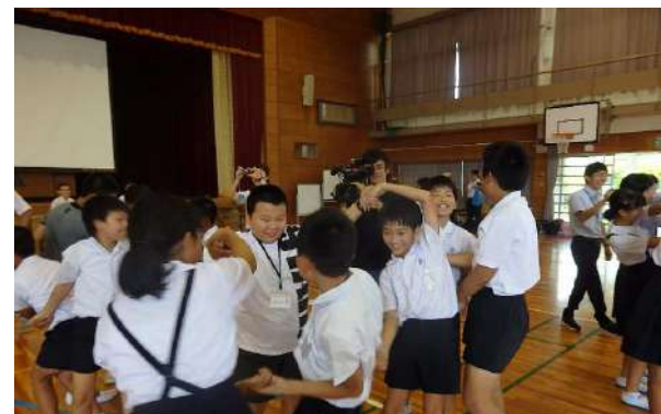
人間知恵の輪 皆で楽しく交流