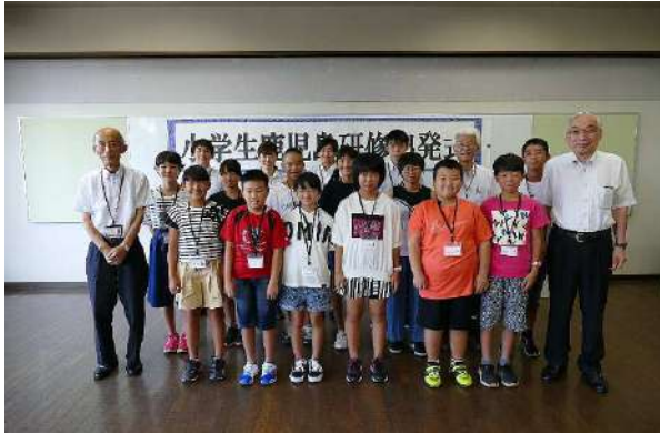
出発式で記念撮影