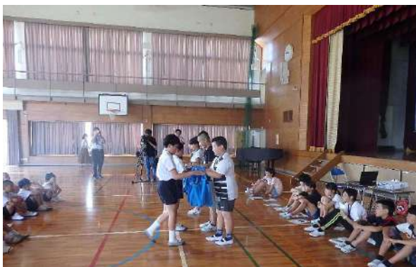
輪之内町からのプレゼント