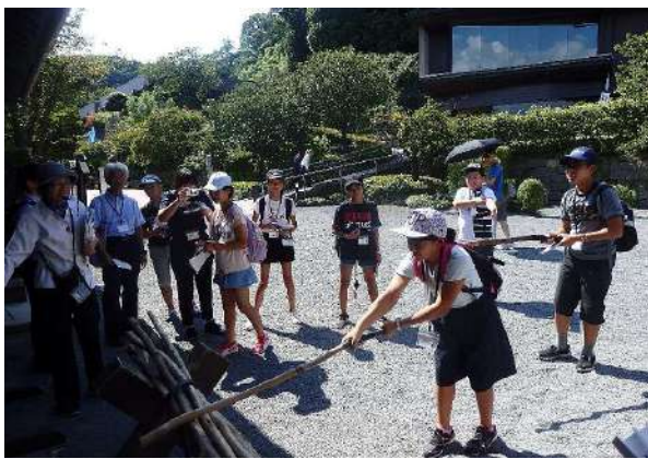
仙巖園・尚古集成館の見学