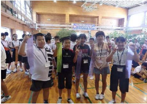
たんざくを大きな竹に飾り付け